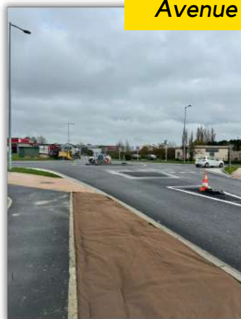
Avenue de l'Europe