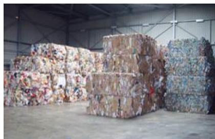
Les tonnages triés puis expédiés vers les filières de recyclage