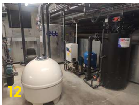
Module de récupération des calories

Pour compléter, optimiser et économiser de la production de chaleur, l'équipement est orienté afin de favoriser une production de chaleur naturelle par ses immenses baies vitrées côté bassins (photo 11).