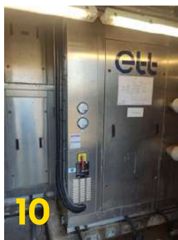
Centrale de traitement d'air