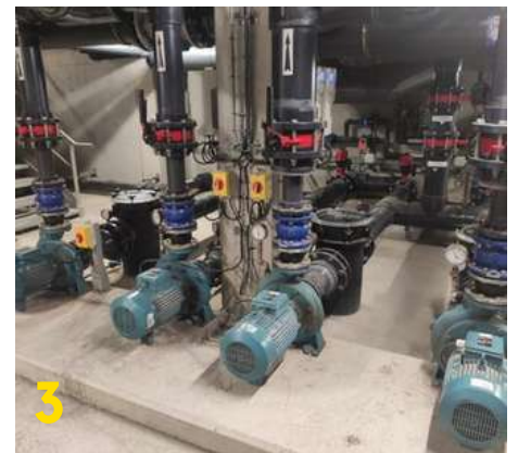
Pompes de circulation

Il y a huit filtres pour les bassins du Centre Aquatique !