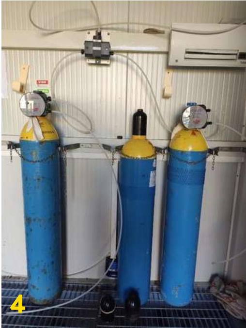
Bouteilles de chlore

Nous utilisons du chlore gazeux et du « PH minus » (solution acide) pour traiter l'eau des bassins dans des mesures règlementées et contrôlées quotidiennement, au minimum deux fois par jour par les deux agents techniques du Centre Aquatique ainsi que mensuellement par l'ARS, l'Agence Régionale de Santé.