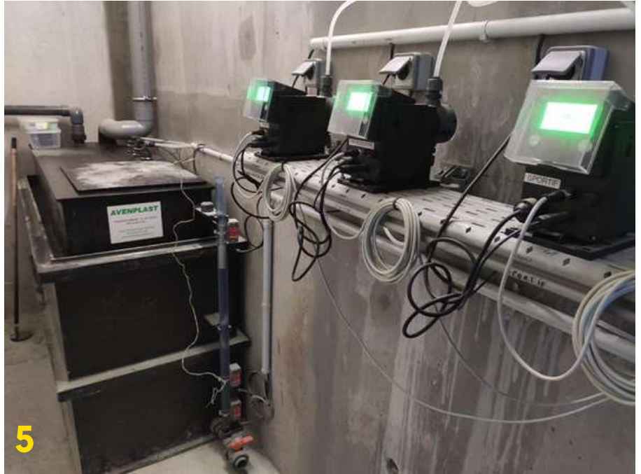
Cuve de PH "minus"

Deux bouteilles de quarante-neuf kilogrammes de chlore sont reliées en permanence au circuit de filtration pour la partie désinfectée et désinfectante (photo 4). La dose de chlore se compte en milligramme par litre d'eau ! Une cuve de mille litres de "PH minus" sert à réguler le PH de l'eau (photo 5).